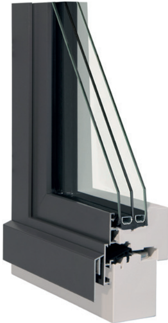
Metallflügelprofile scharfkantig und flächenversetzt